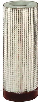
für Mobil 100