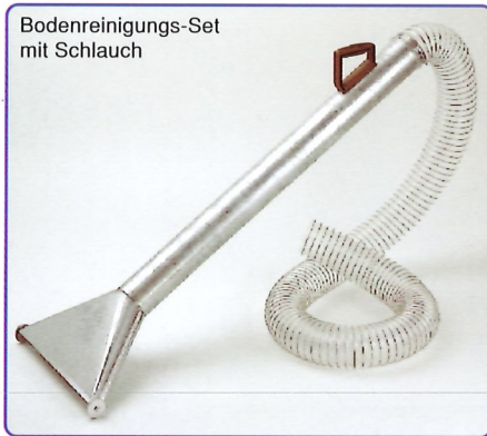
Saugdüse und Fugendüse sind als Zubehör erhältlich.