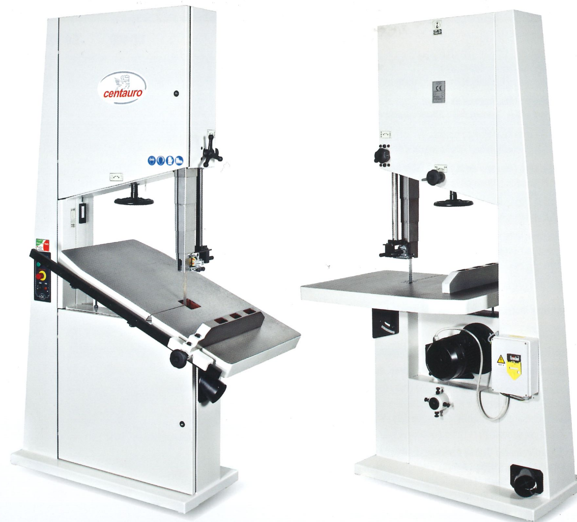
Piano di lavoro inclinabile a destra fino a 45° (max. 20 in versione CE). Table de travail inclinable à droite jusqu'à 45° (max. 20 en version CE). Tilting table up to 45° (max. 20° in CE-version). Neigbarer Arbeitstisch bis 45° (max. 20° bei der CE-Ausführung). Mesa de trabajo inclinable hacia la derecha hasta 45° (máx. 20° en la variante CE).

Guidalame superiore di alta precisione CARTER ideale anche per lame strette e tagli curvi. Guidelame supérieur de haut pré-cision CARTER qui s'adapte aussi aux lames étroites pour découpes courbés. CARTER high-precision top blade guide also ideal for narrow blades and curved cuts. CARTER Hochpräzisions Obere Blattführung geeignet auch für schmale Sägeblätter und gebogene Schnitte. Guía-sierra superior de alta precisión CARTER, específico también para cintas estrechas y cortes sagomados.