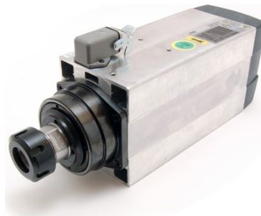
Bild 2. Frässpindel 3.7 KW