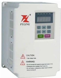
Bild 1. Frequenzinverter