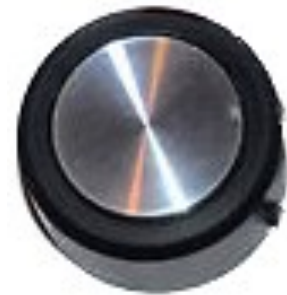
Bild 3. Werkzeuglängen Sensor