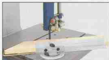
Als Zubehör: Der Winkelanschlag 2 x 45° schwenkbar mit verschiebbarer Anschlagsschiene Bestell - Nr. 41 4060