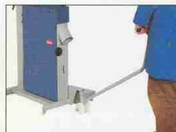
Als Zubehör: Das Hubfahrwerk zum Verfahren der Bandsäge in alle Richtungen, leicht bedienbar durch einfaches Anheben der Bandsäge mit der Hebedeichsel.

Bestell - Nr. 41 4080 Bestell - Nr. 41 4082 Bestell - Nr. 41 4084 Bestell - Nr. 41 4086