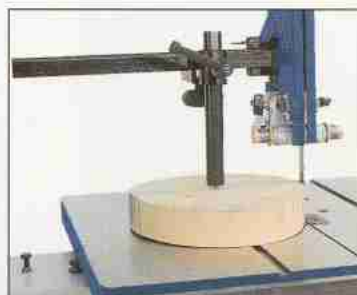
Als Zubehör: Die Kreisschneideeinrichtung, befestigt an der massiven Zahnstangenführung, für maßgenaue und verlauffreie Kreisschnitte.

Für die SN 400 Für die SN 460 Für die SN 560 Für die SN 700