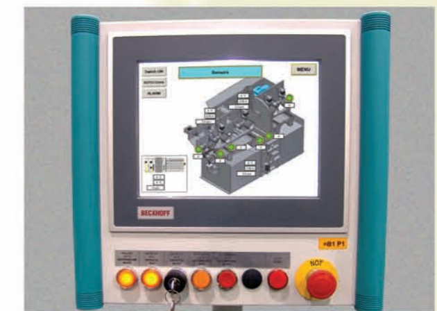
Hochleistungs- SPS mit Vollgrafischem 12" Multi Color Display - Touchscreen.

Patented reject and support flap with large waste chute. Waste wood length up to 400 mm!