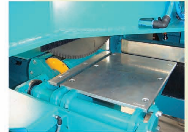
Patentierter Ablass- und Stützklappe mit Großem Abfallschacht. Abfallstücklänge bis 400 mm möglich!

Prepositioning of a saw stroke through servo drive, downward stroke!