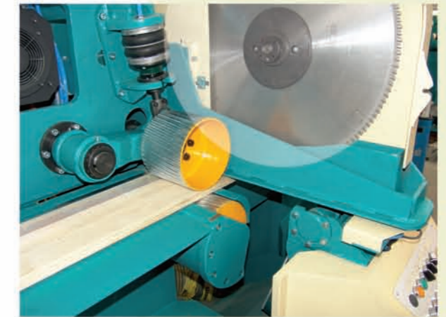
Sägenhub durch Servoantrieb vorpositionierbar von oben wirkend!

Prepositioning of a saw stroke through servo drive, downward stroke!