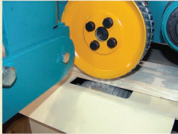
Integriertes Einzugsrollenpaar für kontinuierliche Beschickung (auch Lagenweise und unvereinzelt möglich!).

Continuous feeding is assured by an integrated infeed roll pair (feeding of entire layers and unsingled pieces also possible).