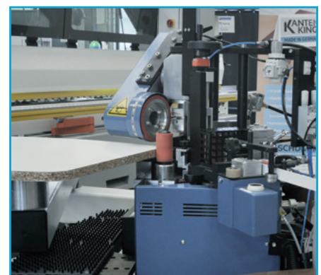
Formteil wird verarbeitet