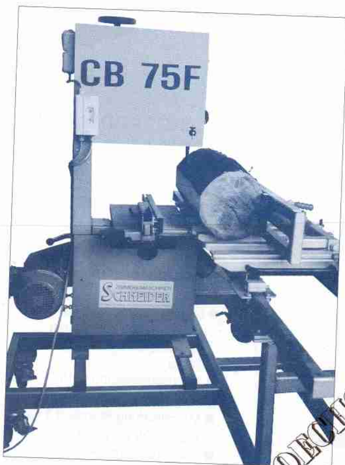
Der Besäumwagen für Bohlen und Rundhölzer bis \varnothing 315 mm

Der sogenannte Besäumwagen sitzt rechts von der Säge und ist auf der gleichen Höhe wie der linke feste Tisch. Die Besäumlänge ist individuell möglich. Der Besäumwagen läuft direkt am Sägeblatt vorbei. Durch einen Laser können z.B. Bohlen oder Keile genau ausgerichtet werden. Zum Auftrennen von Rundhölzern gibt es den Kreuzsupport mit Spannvorrichtung, der Zuschnitte bis hin zum Sägefurnier bei geringstem Schnittverlust ermöglicht. Das maßliche Nachstellen auf Wiederholungsmaße kann durch den Anschlag links vom Sägeblatt eingestellt werden. Diese Maschine ist eine interessante Möglichkeit z.B. hochwertige Rundhölzer mit kurzen Stamm einer wirtschaftlichen Nutzung zuzuführen. Obsthölzer sind hier ein gutes Beispiel. Auch für Holzschindelhersteller ist diese Maschine gut verwendbar.