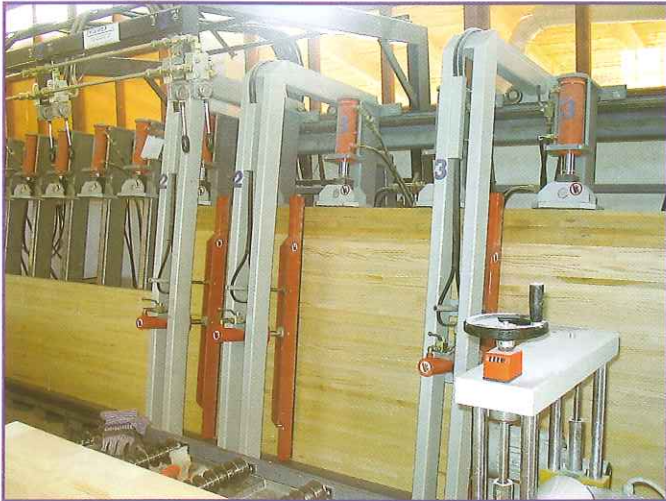
Detail of aligning unit in operation