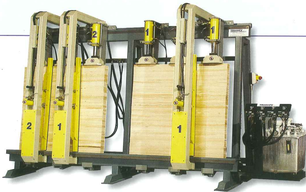
SLV - H

PRENSAS HIDRAULICAS PARA VIGAS LAMINADAS Y TABLEROS ALISTONADOS