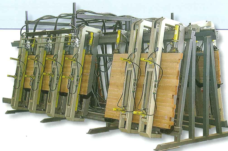
SLV - H/D