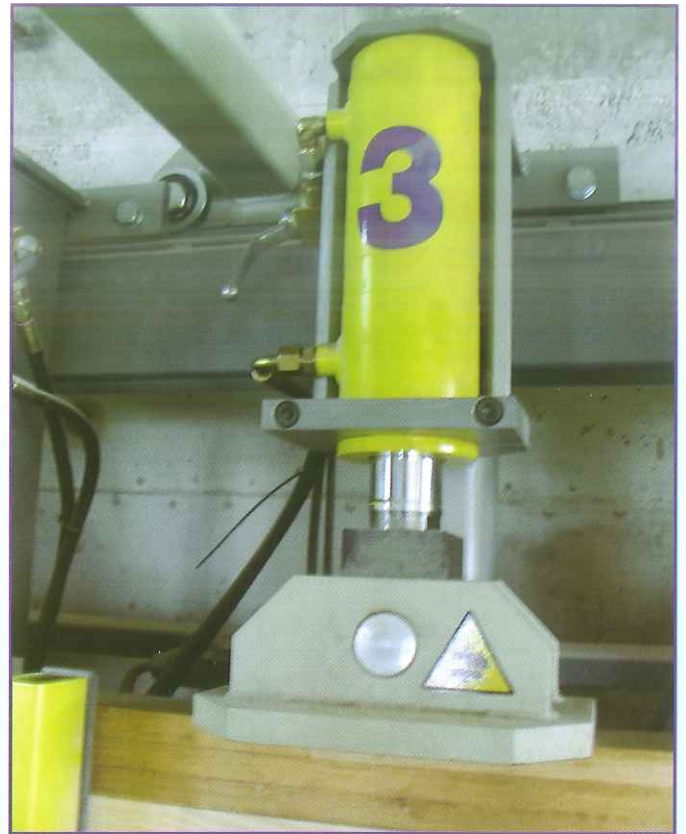
Detail of pressing cylinder