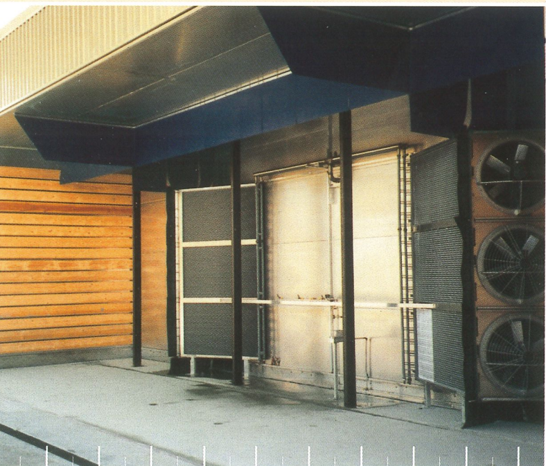
Bauholztrockner mit HV-SYSTEM