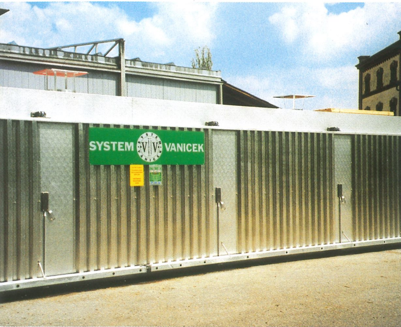
HOCHTEMPERATURTROCKNER in Containerform für ~ 15 m 3