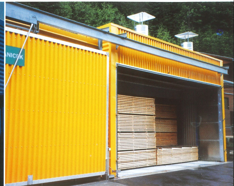
Weichholztrockner mit ZWISCHENDECKEN-SYSTEM