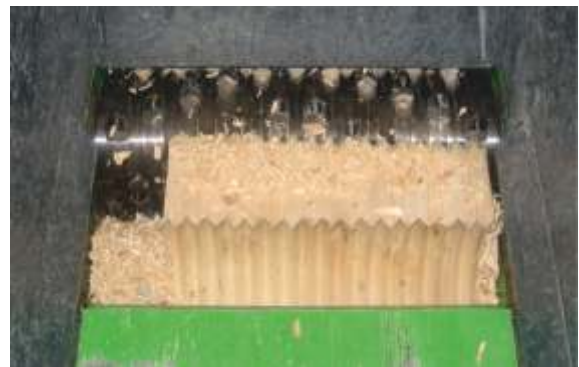
EZ 8/2 speziell zur Zerkleinerung von großen Leimbändern