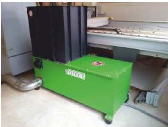
EZ 6/1 neben einer Plattenaufteilsäge zur Zerkleinerung von Spanplatten- und Multiplex-Platten Resten