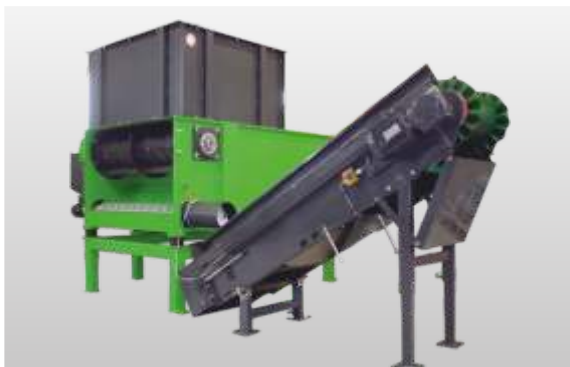
EZ 13/2 mit Austragsschnecke auf einem Podest zum Weitertransport des Materials auf ein Förderband