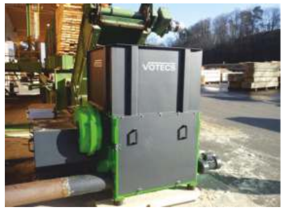
EZ 10/2 mit 37 KW, Befüllung mit Restholz über Förderband, Materialaustrag mit Austragsschnecke zum Kratzbodenförderer