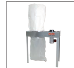
Abb. AAS 1013

Die besonders robuste Konstruktion aus langlebigen Qualitätsbauteilen wird als Ganzmetallgehäuse aus verzinktem Stahlblech gefertigt. Weitestgehend vormontierte Elemente mit beiliegendem Filtersack, Spänesack, Stützfüßen und montiertem Schalter garantieren kurze Montagezeiten.