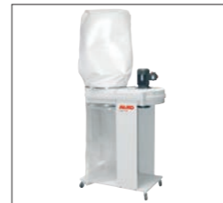
Abb. vgl. MOBIL 125-200