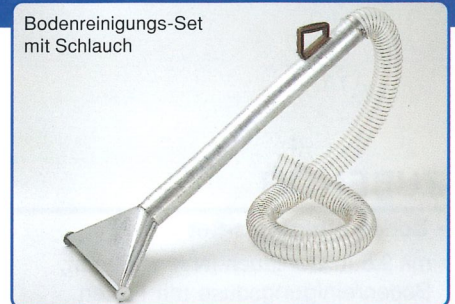
Bodenreinigungs-Set mit Schlauch

Saugdüse und Fugendüse als Zubehör erhältlich.