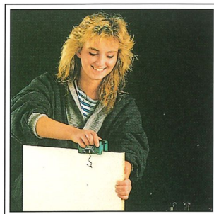
AU 93 Kantenbündelschneider für gerade Werkstücke. Kantendicke bis 1,0 mm.