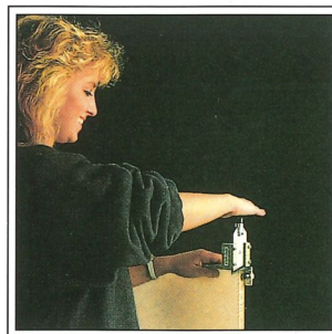
HK 1 Handkappgerät für gerade Werkstücke. Kantendicke bis 1,0 mm.