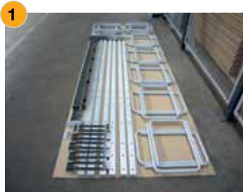
1 Einzelteile Resteregal ohne Fachböden

Zu dem Restmanagement bietet BARGSTEDT das passende Resteregal gleich mit an. Einfach im Aufbau und variabel erweiterbar ist das Resteregal frei im Raum platzierbar und bietet viel Spielraum für die platzsparende Lagerung von kleinteiligen Materialresten.