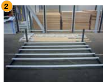
2 Vormontage der Horizontalträger