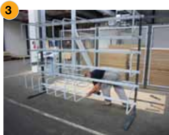
3 Verschrauben der Rohrbügel