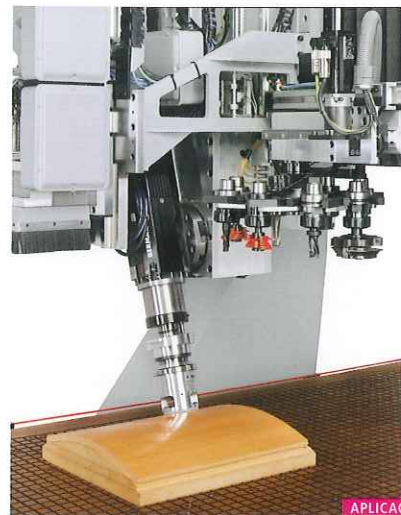
APLICACIONES ... APPLICATIONS

Su estructura de puente móvil, sus elevadas prestaciones dinámicas, modularidad y potencia presentan a esta máquina como la solución perfecta para el mecanizado de piezas que requieren gran calidad y precisión en los acabados.