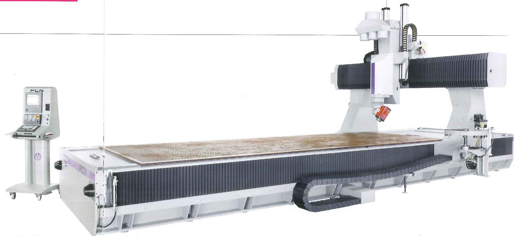
LA MAQUINA ... THE MACHINE