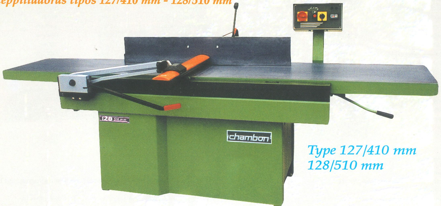
Type 127/410 mm 128/510 mm

Ceppilladoras tipos 127/410 mm - 128/510 mm