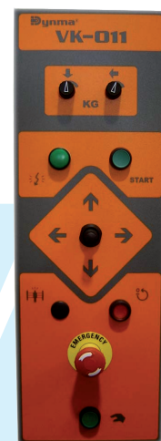
Detalle del panel de control en la versión ECO.

Copyright 2011. Desarrollo Industrial de Maquinaria Benicarló S.L. La información contenida en este documento puede sufrir variaciones y, por lo tanto, no es vinculante.