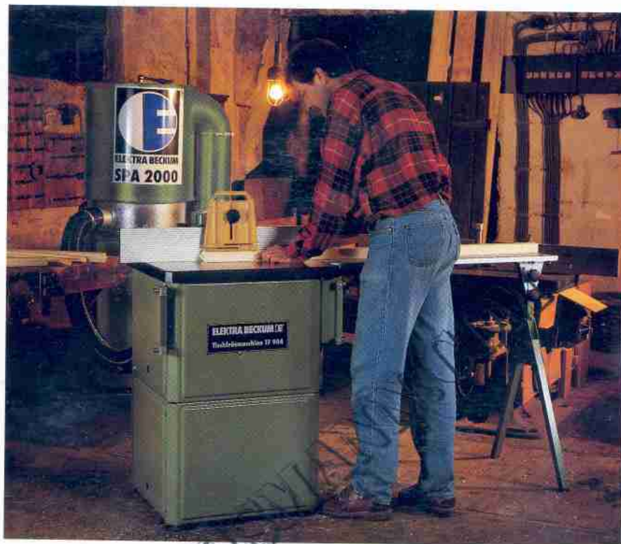
◀ Profil zeigen. Die SPA an der TF 904.

Die SPA 2000 können Sie an alle Holzbearbeitungsmaschinen von Elektra Beckum mit einer Anschlußmöglichkeit zum Späneabsaugen anschließen. Die technischen Daten für die Späneabsauganlage SPA 2000 von Elektra Beckum finden Sie auf der folgenden Seite.