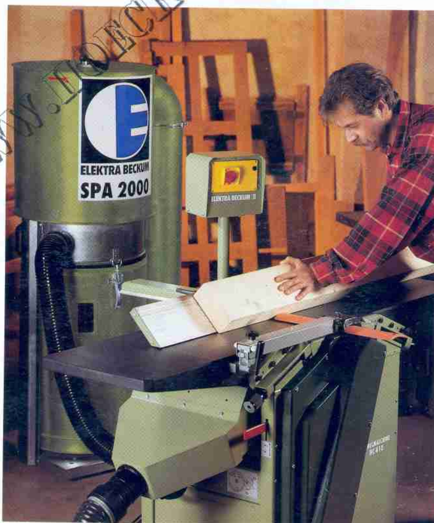
◀ Hobeln ohne Späne. Die SPA an der HC 410.