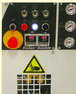
przejrzysty pulpit obsługowy