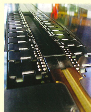
łańcuch przegubowy ze stali szlachetnej

Zastrzega się prawo do wprowadzenia zmian technicznych / Ilustracje zawierają opcje