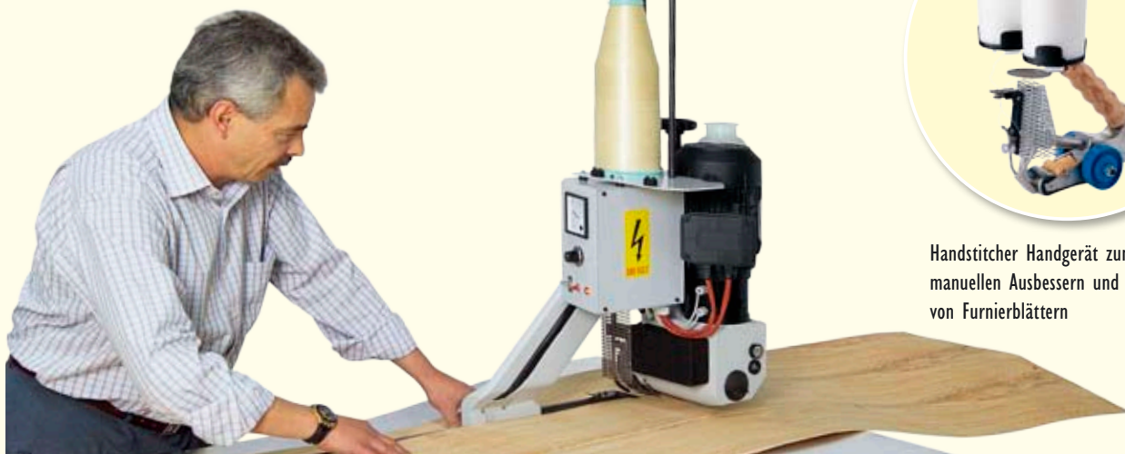
Handstitcher Handgerät zum manuellen Ausbessern und Abkleben von Furnierblättern

Als Klebmedium dienen wahlweise ein oder zwei Leimfäden, die in Zick-Zack oder Wellenlinie von einem beheizten Fadenführer aufgetragen werden.