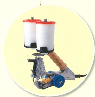
Urządzenie ręczne do ręcznego naprawiania i klejenia listków forniru.