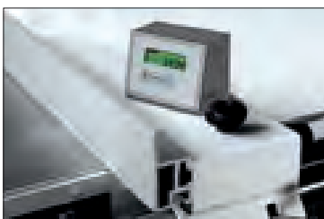
Option Electronic display of the rip fence positioning LED-Anzeige der Position des Parallelanschlags Электронный счетчик положения параллельного упора