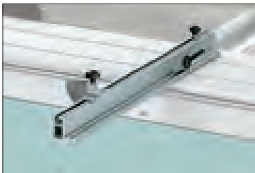
Option +30°-45° tilting aluminium fence Alu-Gehrungsanschlag +30°-45° Алюминиевый упор +30°-45°