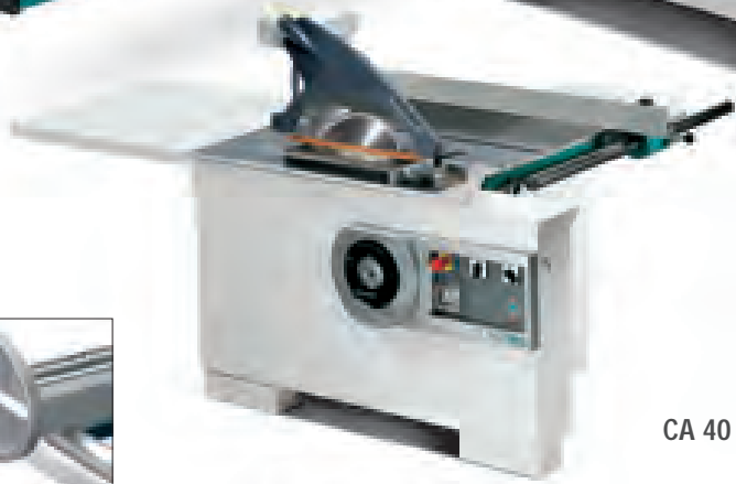
CA 40 PF