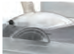
BASIC safety guard BASIC Schutzvorrichtung Защита пилы Basic