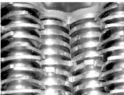
Schneid- und Räumscheiben

Mit den Vierwellenzerkleinerern der Baureihe GZ können sehr lange und sperrige Holzabfälle wie z. B. Althölzer, lange Bretter, Paletten und Verpackungen, sowie Kartonagen aller Art ideal zerkleinert und aufbereitet werden. Die Vierwellenzerkleinerer kommen hauptsächlich im holzverarbeitenden Gewerbe zum Einsatz.