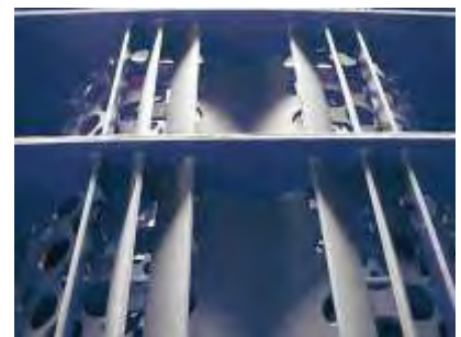
Sieb mit Nachbrecherleisten