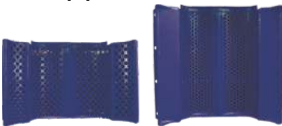
Siebe mit unterschiedlichen Lochdurchmessern