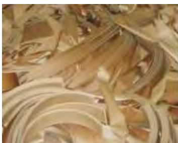
Abfälle aus der Möbelherstellung