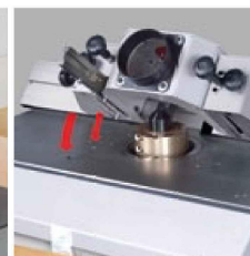
Das MULTI- Einstellsystem mit Parallelführung und Schnelleinstellung