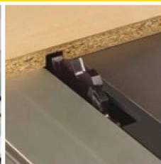
Nuten, Zapfen und Schlitzen mit der Kreissäge