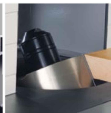
Fräse schwenkbar 90°–45°