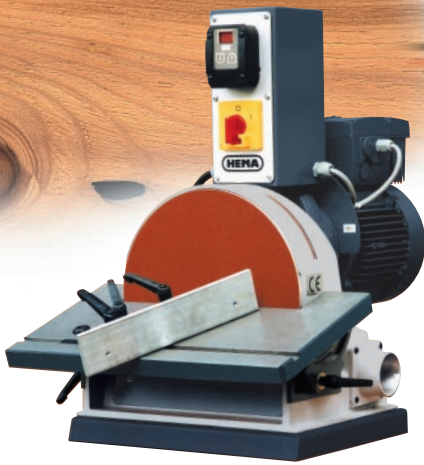
Spezialausführung mit stufenlosem Antrieb

Zu den Vorzügen und Qualitätsmerkmalen gehören: Eingebauter Ventilator für erstklassige Staubabsaugung, Rechts- und Linkslauf, stabiler Graugusstisch in 2 präzisen Schwenksegmenten geführt, geräuscharmer Lauf.