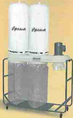
Abb. zeigt Bauart ASA 2553 + ASA 3053