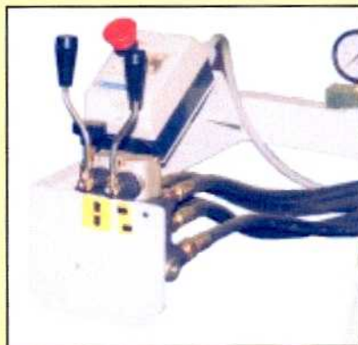
Dispositivo di comando manuale con valvole idrauliche.

Mod. PROGRAM/30 hydraulic frame press having the possibility to adjust the vertical and horizontal thrusts. The frame press is available with louvre window device and/or it's possible to assembly IRREGULAR frames. Available in three different sizes.