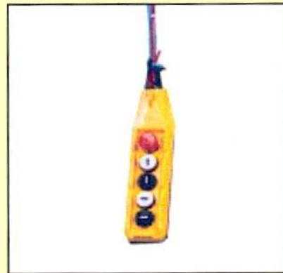
Pulsantiera pensile di comando.