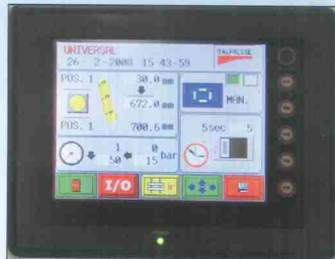
Interfaccia computerizzata per il controllo assi "TS/500" 'Touch-screen' operator interface TS/500