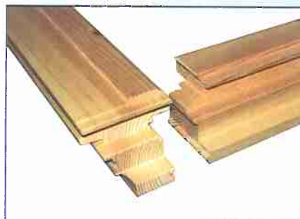
CICLI SPECIALI nel caso di telai sottili/delicati o infissi prefiniti SPECIAL CYCLE in case of light or pre-finished frames