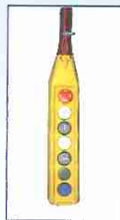
Pulsantiera pensile Hanging push-button strip