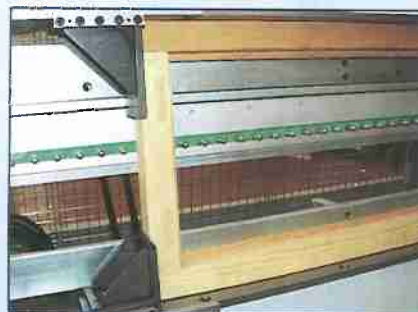
barra griglie sdoppiata a passo variabile bar in two parts with variable pitch