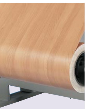
Slitting unit with circular knife on the roll stand.

Feel free to send us samples of your materials for test cuts – we shall then be glad to advise you.