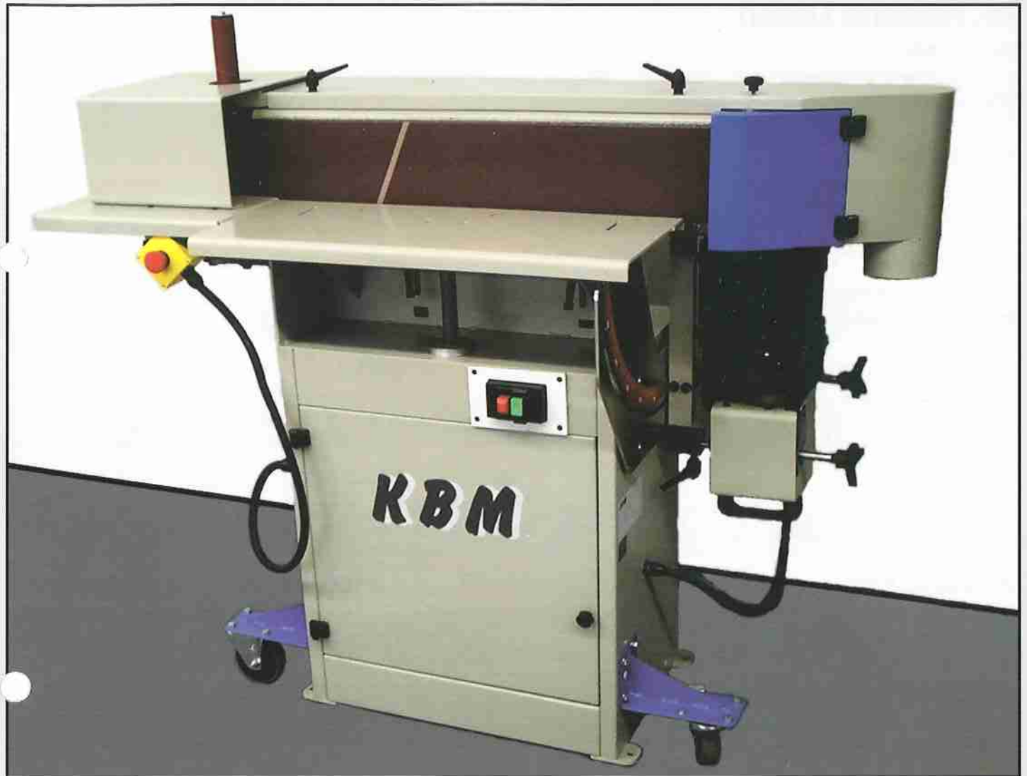
Abb. KST 900 mit Fahrwerk (auf Wunsch).