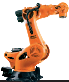
14 KR 1000 L 950 PA KR 1000 L 1300 PA