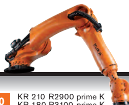
40 KR 210 R2900 prime K KR 180 R3100 prime K KR 150 R3300 prime K KR 120 R3500 prime K KR 90 R3700 prime K