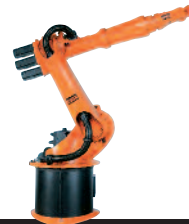
29 KR 16 L6