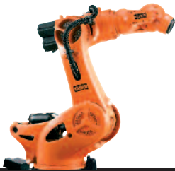
09 KR 1000 titan