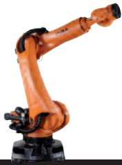
01 KR 120 R2500 pro KR 90 R2700 pro