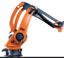
10 KR 40 PA