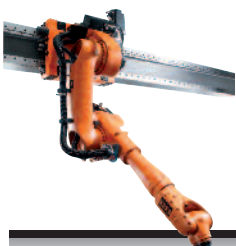
18 KR 30 jet KR 60 jet