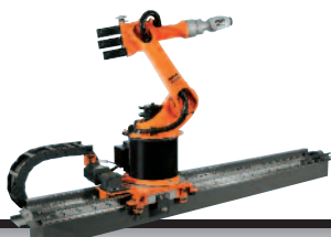
19 KL 250-3