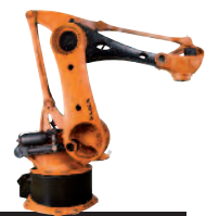
13 KR 700 PA