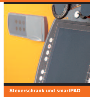
Steuerschrank und smartPAD