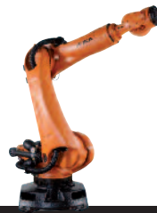
03 KR 240 R2500 prime KR 210 R2700 prime KR 180 R2900 prime KR 150 R3100 prime