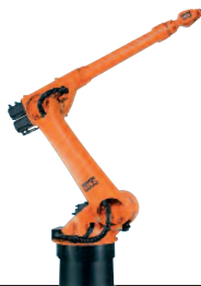
36 KR 30 L16-2