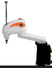
23 KR 5 scara