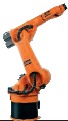
35 KR 30-3 KR 60-3