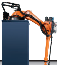
39 KR 60 L 16-2 KS