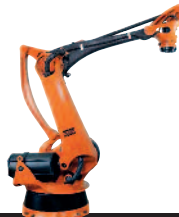
11 KR 100-2 PA KR 180-2 PA