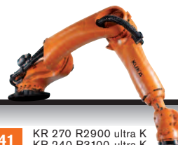
41 KR 270 R2900 ultra K KR 240 R3100 ultra K KR 210 R3300 ultra K KR 180 R3500 ultra K KR 150 R3700 ultra K KR 120 R3900 ultra K