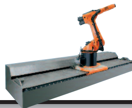
20 KL 1000-2