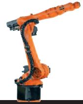
25 KR 5 arc