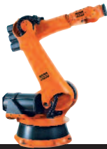
05 KR 150-2 Serie 2000 KR 180-2 Serie 2000 KR 210-2 Serie 2000 KR 240-2 Serie 2000 KR 270-2 Serie 2000