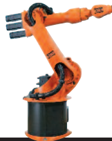
28 KR 16-2 KR 16-2 S