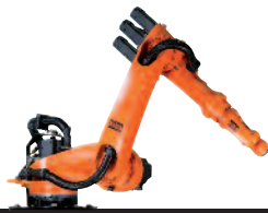
32 KR 6-2 KS