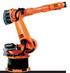
17 KR 360 L150-2 P