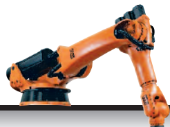
15 KR 80 2 P