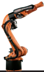
26 KR 5 arc HW