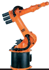
27 KR 6-2