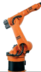
37 KR 30-3 HA KR 60-3 HA