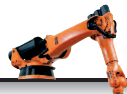
42 KR 150-2 K Serie 2000 KR 180-2 K Serie 2000 KR 210-2 K Serie 2000