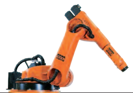
38 KR 30-4 KS KR 60-4 KS