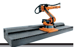
21 KL 1500-3