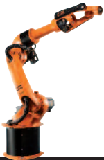
31 KR 16 L8 arc HW