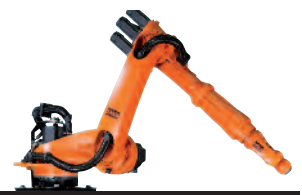
34 KR 16 L6-2 KS