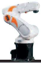
22 KR 5 sixx