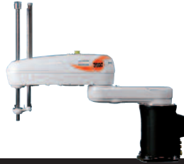
24 KR 10 scara