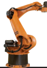
12 KR 300 PA KR 470 PA