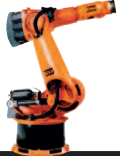
08 KR 500-2 MT