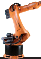
07 KR 360-3 KR 500-3