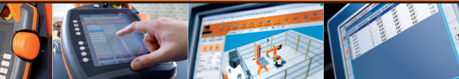
SmartPAD mit Touch Screen

KUKA hat als erster Hersteller Roboter auf den Markt gebracht, die über das World Wide Web erreichbar sind.