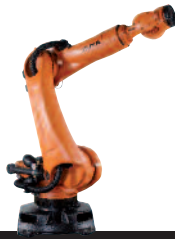
02 KR 210 R2700 extra KR 180 R2500 extra KR 150 R2700 extra KR 120 R2900 extra KR 90 R3100 extra