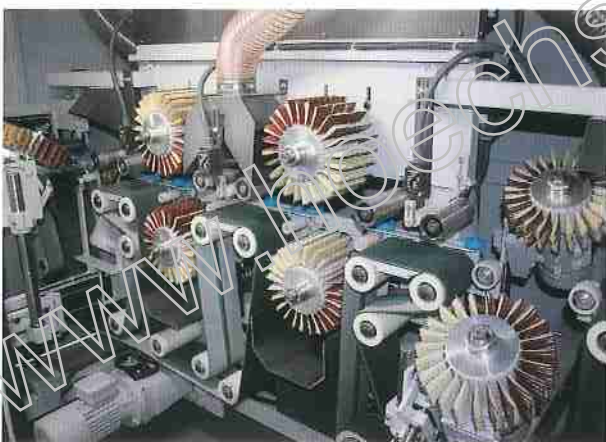
Leistomat LZ 8, Bearbeitung von: