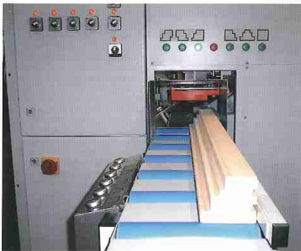
Standardprofilvorbereitung per Taster mit 6 Grundprofilen