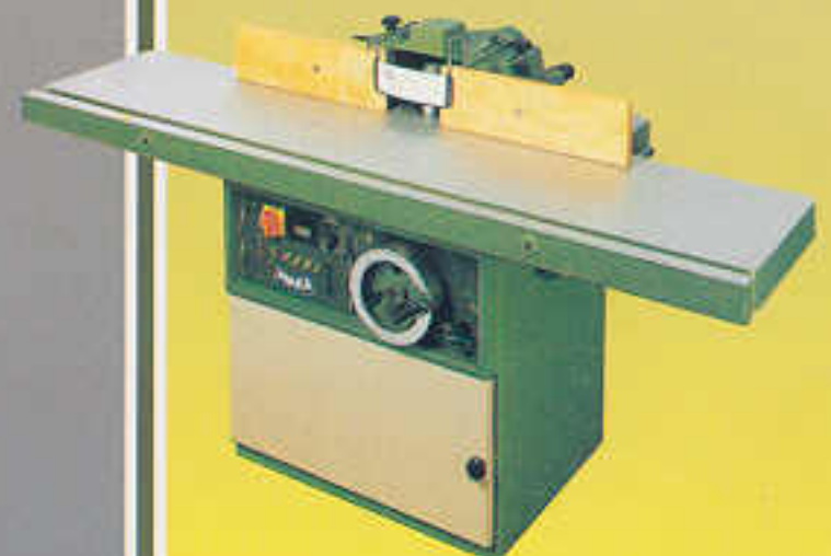
T 1000 V mit Tischverlängerung