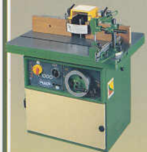
T 1000 RT mit Rolltisch