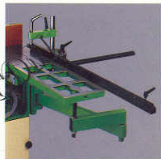
Schiebetisch und Alu-Anschlag 660x280