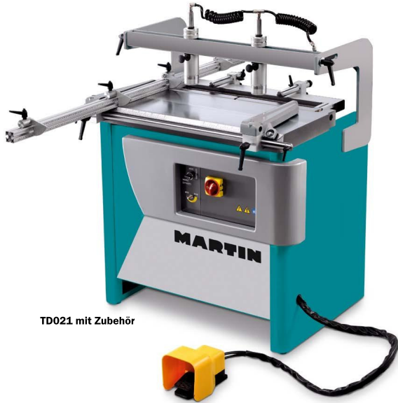
TD021 mit Zubehör

der Maschinen erhalten Sie ein Anschlagssystem mit 4 Anschlagreitern, die Sie Werkstücke bis 3000 mm Länge exakt bearbeiten lassen. Zwei sich selbst auf die Werkstückstärke anpassende Druckluftspanner halten die Werkstücke sicher und sorgen für effizientes Arbeiten.