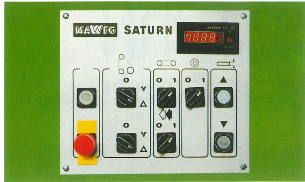
Bedientafel mit Digitalanzeige (Sonderzubehör)