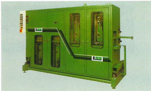
Finish-Schleifmaschine Saturn Quattro