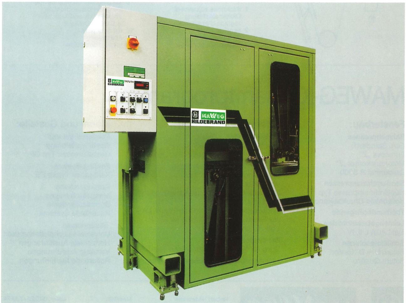
Finish-Schleifmaschine Saturn D Comfort