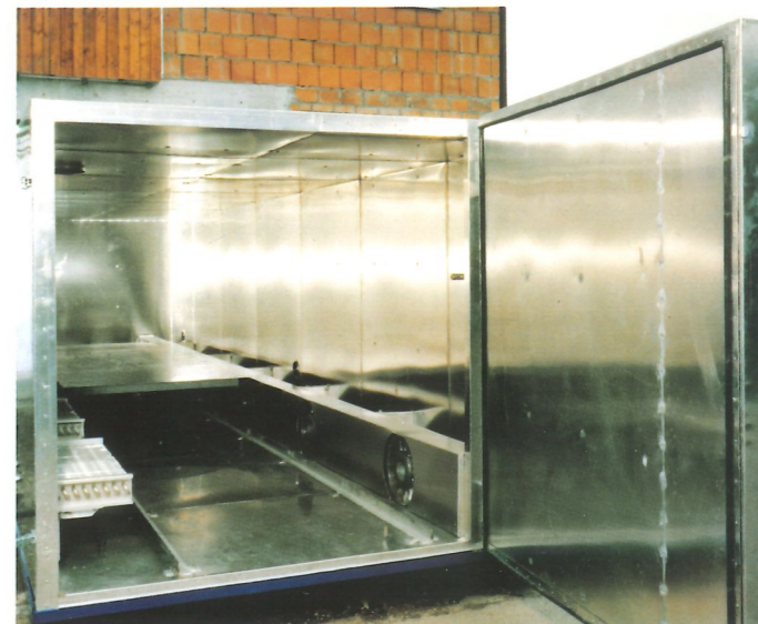
Querbelüftete Trockenkammer, wagenbeschickt, Flügeltür stirnseitig, Elektro- und Warmwasserheizung, automatisch umschaltbar, Stapellänge bis max. 12,5 m, Bruttostapelinhalt 4 bis 25 m 3 , Lieferung steckerfertig.