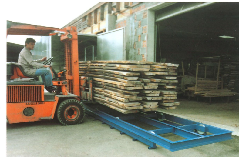
Querbelüftete Trockenkammer für 2 Stapelpakete, wagenbeschickt, Flügeltür stirnseitig, Elektro- und Warmwasserheizung, automatisch umschaltbar, Stapellänge beliebig, Bruttostapelinhalt 10 bis ca. 100 m 3 , Lieferung steckerfertig.