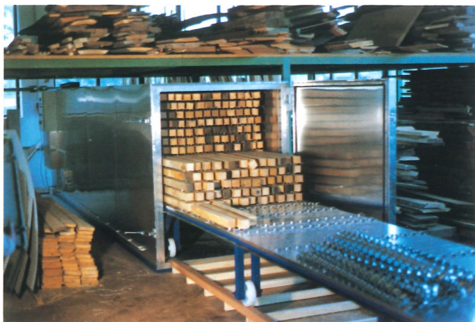
Längsbelüftete Trockenkammer, wagenbeschickt, Flügeltür stirnseitig, Elektro- und Warmwasserheizung, 1200 Kcal/h, automatisch umschaltbar, Stapellänge 5,20 m, Stapelbreite 1,15 m, Stapelhöhe 1,00 m, Bruttostapelinhalt 6 m 3 , Steuerung Computer C-2000

die Kammer gestapelt. Zur Belüftung genügt ein einziger Ventilator, der die Luft längs durch den Stapel bewegt. Dadurch brauchen Sie nur einen geringen Stromanschlußwert für den Ventilator. Und durch die kompakte Bauweise ergibt sich ein günstiges Preis-Rauminhalt-Verhältnis. Eine Mühlböck-Längsbelüftungsanlage ist überall dort ideal einzusetzen, wo kleinere Holz mengen zu trocknen sind. 1 Jahr volle Garantie ist der Beweis für den unübertroffenen Qualitätsstandard jeder Mühlböck-Holz Trocknungsanlage.