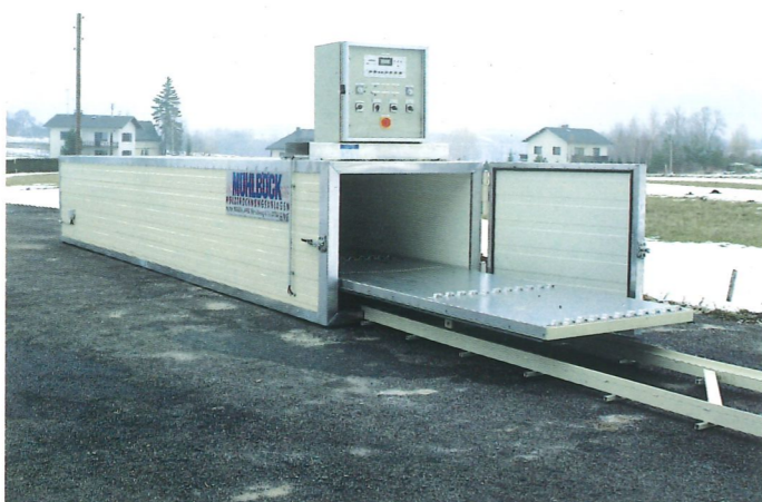
Längsbelüftete Trockenkammer, wagenbeschickt, Flügeltür stirnseitig, Elektro- und Warmwasserheizung, 11.000 Kcal/h, automatisch umschaltbar, Stapellänge 6,20 m, Stapelbreite 0,90 m, Stapelhöhe 1,00 m, Bruttostapelinhalt 5,6 m 3 , Steuerung halbautomatisch