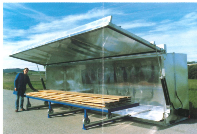
Längsbelüftete Trockenkammer, Hubtor hydraulisch betätigt an der Kammerlängsseite, Elektro- und Warmwasserheizung, 1200 Kcal/h, automatisch umschaltbar, Stapellänge 6,20 m, Stapelbreite 1,15 m, Stapelhöhe 1,2 m, Bruttostapelinhalt 8,55 m 3 , Steuerung Computer C-2000