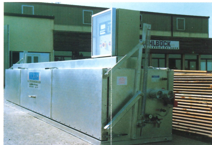
Längsbelüftete Trockenkammer, Hubtor federzugentlastet an der Kammerlängsseite, Elektro- und Warmwasserheizung, 1200 Kcal/h, automatisch umschaltbar, Stapellänge 5,20 m, Stapelbreite 1,15 m, Stapelhöhe 1,00 m, Bruttostapelinhalt 6 m 3 , Steuerung Computer C-2000