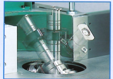
Fräsdorn schwenkbar +/- 45°