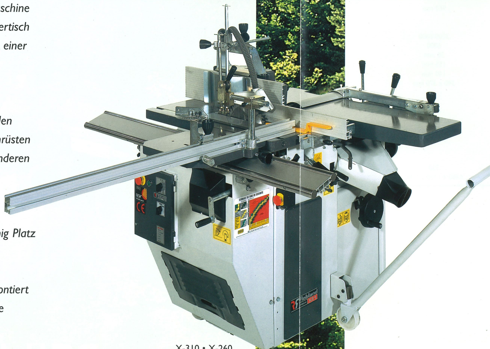
X-310 • X-260