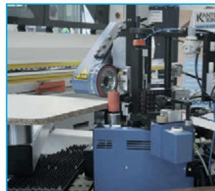
Formteil wird verarbeitet