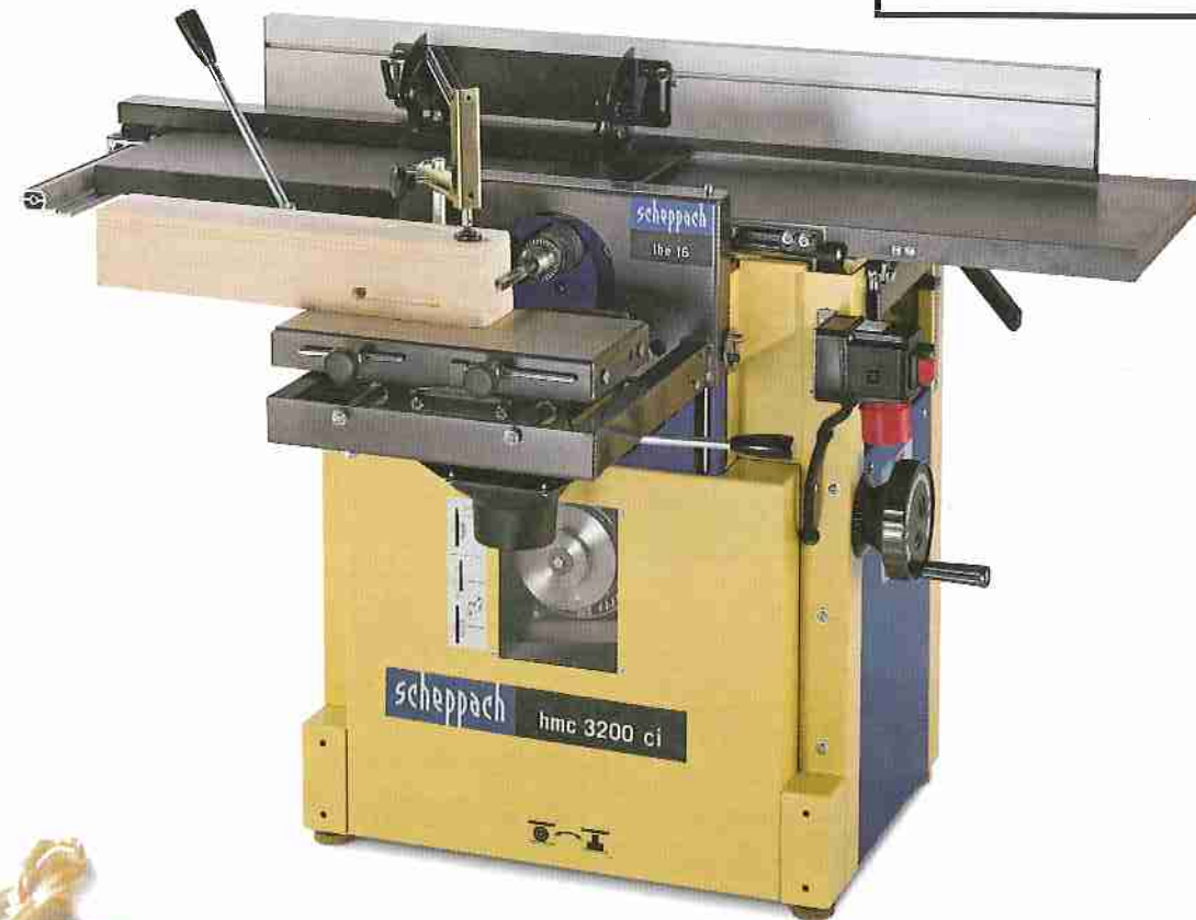
Hobelmaschine und Anbaugerät laufen getrennt jeweils über einen stark belastbaren Riemen-Antrieb.