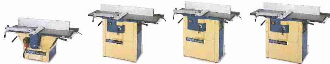
hms 260ci hms 3200ci hmc 2600ci hmc 3200ci