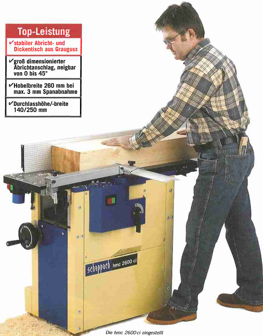
Die hmc 2600ci eingestellt zum Abrichthobeln.

Spanabnahme über eine Skala arbeiten Sie mit höchster Präzision.