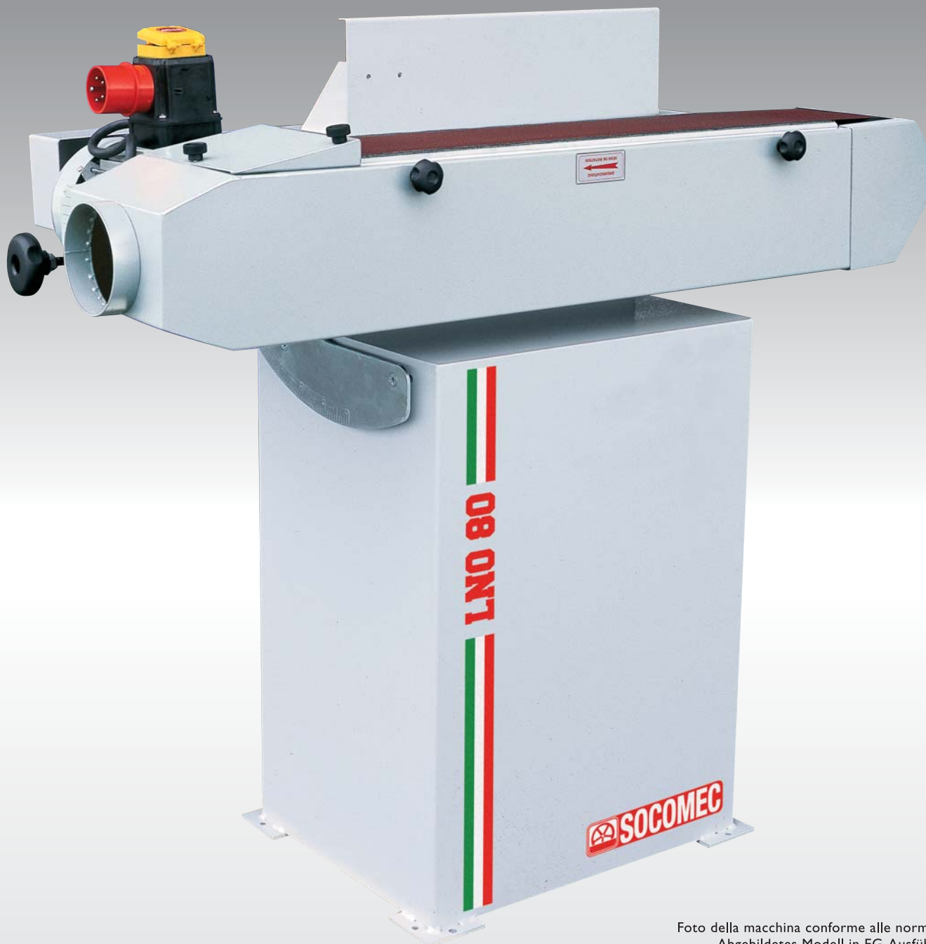
Foto della macchina conforme alle norme CE • Abgebildetes Modell in EG-Ausführung • Picture of the machine in CE version • Photo de la machine conforme aux normes CE • Foto de la maquina conforme normas CE •

LEVIGATRICE PER BORDIA NASTRO OSCILLANTE KANTENSCHLEIFMASCHINE MIT BAND OSZILATION EDGE SANDING MACHINE WITH OSCILLATING BELT PONCEUSE DE CHANTS À BANDE OSCILLANTE LIJADORA DE CONTORNOS CON BANDA OSCILLANTE