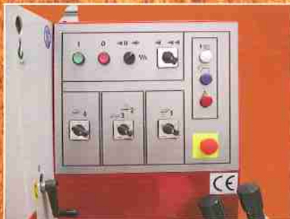
Steuerpaneel FWP 234E