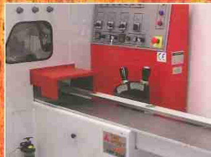
Eingangstisch FWP 235E