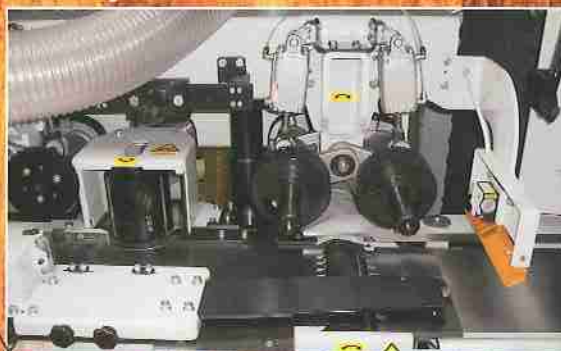
Erste und rechte Spindel FWP 235E