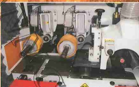
Obera und linke Spindel FWP 235E