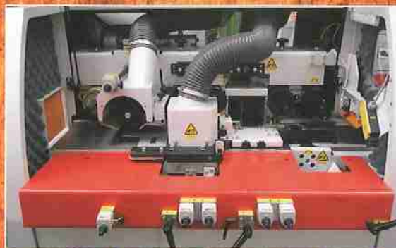
Arbeitseinheit FWP 234E