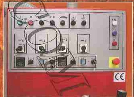
Steuerpaneel FWP 235E