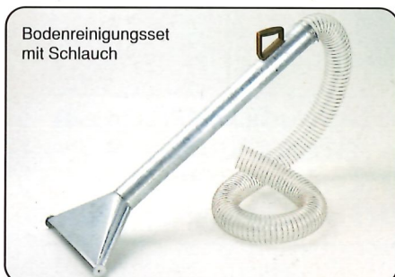
Bodenreinigungsset mit Schlauch

Gemäß den gesetzlichen Vorschriften der TRGS 553 - sind auch kleine späne- und staubproduzierende Maschinen im Holzverarbeitenden Gewerbe- und Industriebetrieb, die nicht an eine Zentralabsaugung angeschlossen sind, mit einem geprüften Entstauber abzusaugen.