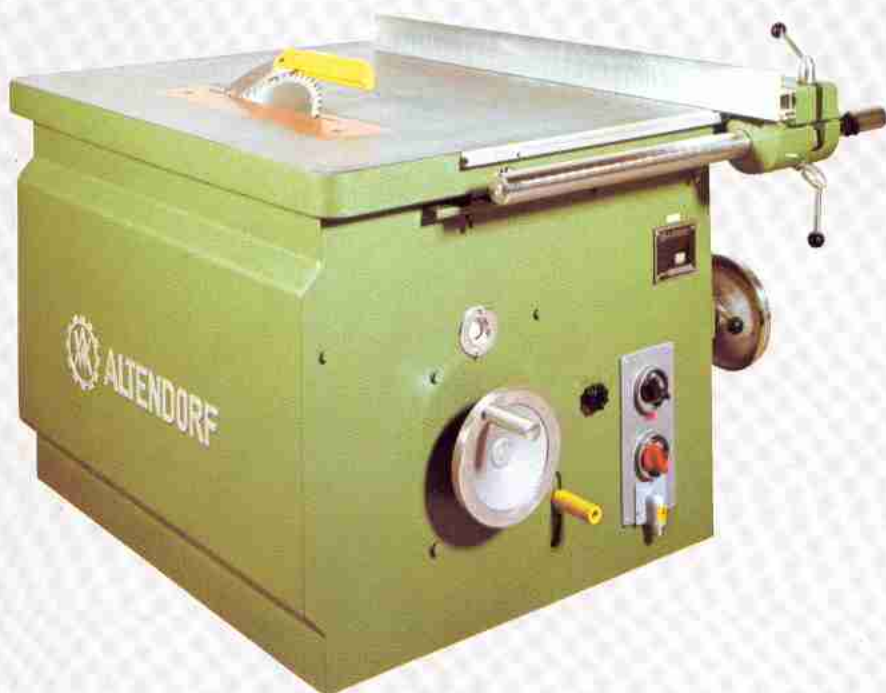
Type TK 45 (auch mit nicht schwenkbarem Sägeblatt lieferbar als Type TK 90)