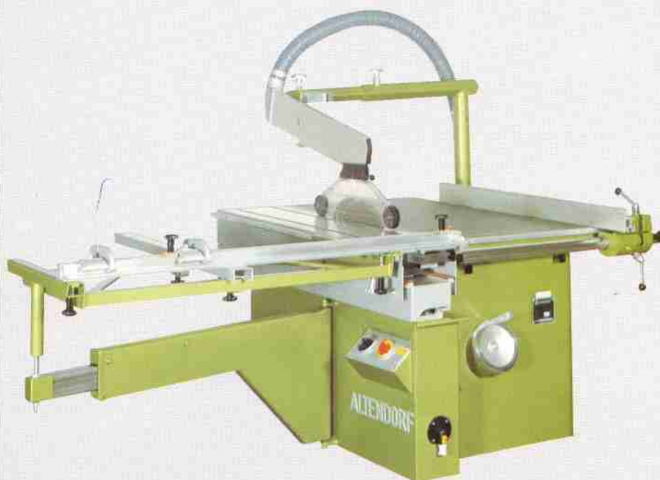
Type TKR 90 (auch mit bis zu 45° schwenkbarem Sägeblatt lieferbar als Type TKR 45)

Als Spezialist für Präzisionssägen hat ALTENDORF sein Programm nach unten durch die Konzeption einer Tischkreissäge abgerundet. Alle Teile und Funktionen der altbewährten Formatkreissägen wurden hierbei soweit wie irgend möglich übernommen. Beide Typen haben Fahreinrichtungen, serienmäßig einen Gehrungsanschlag, 4 Drehzahlen und können mit Vorritzaggregaten bezogen werden. Auch hier der hohe technische Standard und die Ausgereiftheit der Konstruktion.