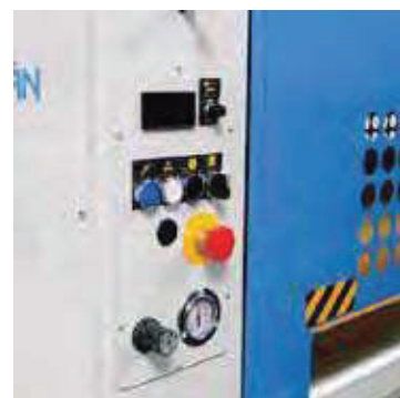
Digital Control of the roller temperature (option).