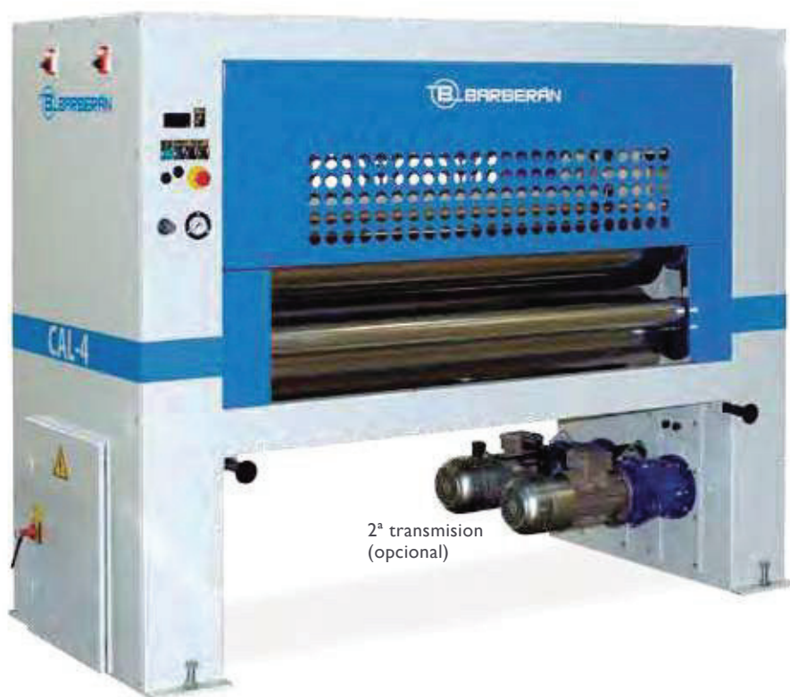
2ª transmisión (opcional)

Máquina pesada diseñada para el prensado con calor de tableros con el fin de atemperarlo o de laminar un folio sobre él cuando actúe como calandra laminadora.