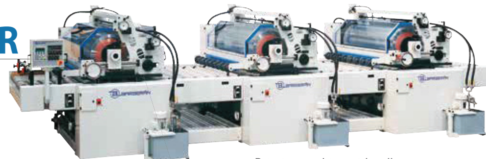
Printing machine with roller conveyor Impresora con transporte a rodillo