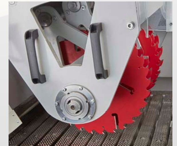
Albero porta lame controsupportato