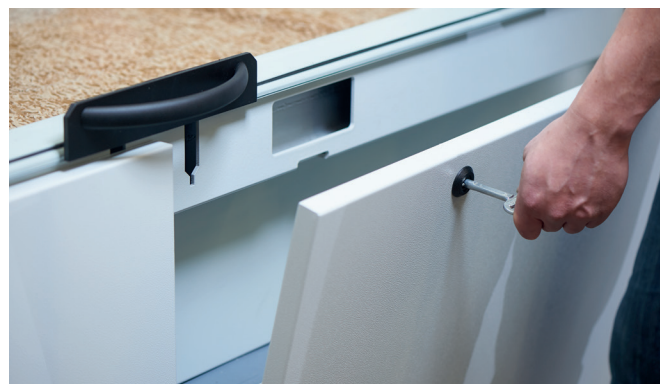
Durchdachte Maschinendetails für einfache Rüstung und einfache Wartung.

All filter units are fitted with a quick-change system. 5 filter levels result in perfect air purification and ideal air quality in the spray cabinet and ensure high quality results.