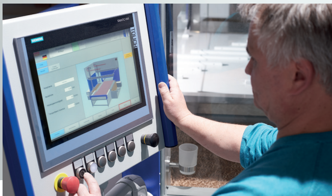
Einfach zu verstehen, optimal zu bedienen - das für Bürkle Anlagen einheitliche Bedienpanel erklärt sich von selbst.

Easy-to-understand, user-friendly and uniform for all Bürkle products – the HMI is self-explanatory.