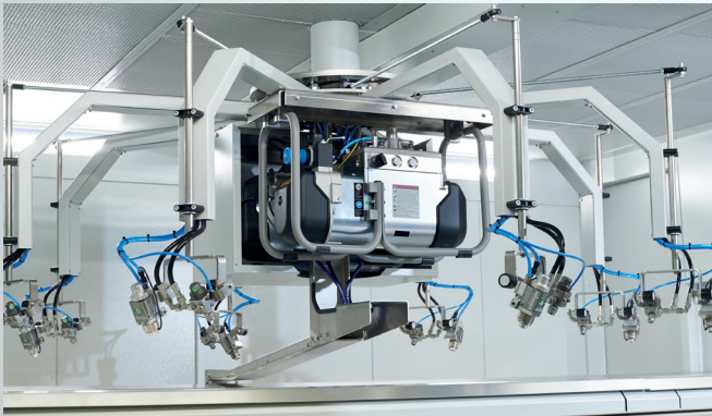
ROBUS pro mit Rotationssystem mit Pistolennachführung und bis zu 8+8 Pistolen. ROBUS pro with Rotary system incl. gun tracking with up to 8+8 guns.