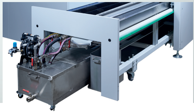
Lackrückgewinnungs- und Bandreinigungseinheit mit durchdachten Detaillösungen.

Easy-to-understand, user-friendly and uniform for all Bürkle products – the HMI is self-explanatory.