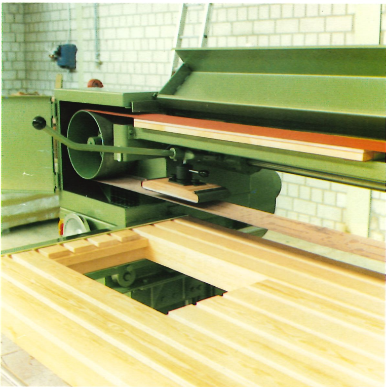
Schleiftisch mit Ausnehmung zum Korpusschleifen