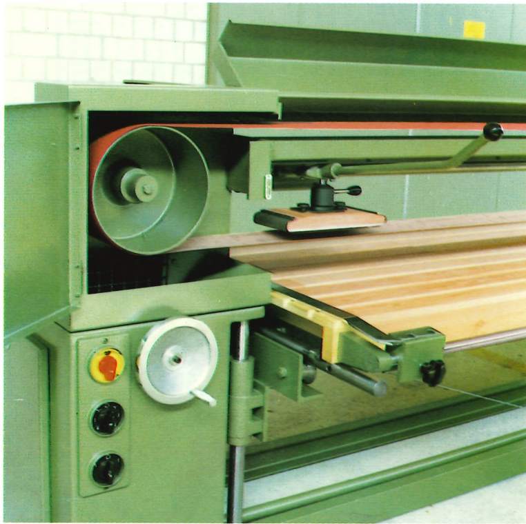
Antriebsseite mit Bedienelementen