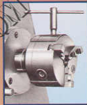
A4 Mandrino autocentrante 3 morse Mandrin à 3 mors Three jaw chuck Drehbackenfutter Ø 80-100-130-160-200 mm