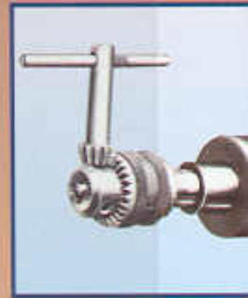
A5 Mandrino porta punta Ø 13 mm Mandrin porte-mèche Ø 13 mm Drill chuck Ø 13 mm Zahnkranzfutter Ø 13 mm