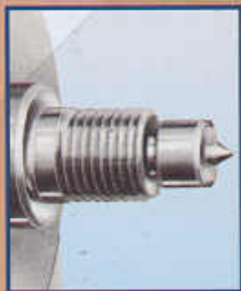
A2 Punta fissa Pointe normale Headstock center Spindelstockspitze