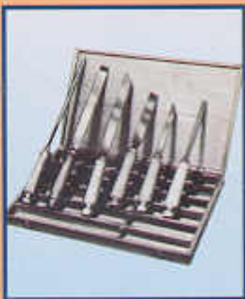
A12 Cassetta utensili a mano Boite outils Handtool kit Werkzeugkoffer