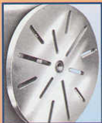
A11 Piattaforma Ø 360 mm Plateau Ø 360 mm Planscheibe 360 mm Ø Platform 360 mm Ø