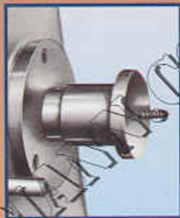
A3 Platorello con vite di trascinamento Manchon avec queue de cochon Screw center Mitnehmer mit Holzschraube