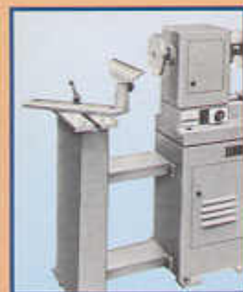
A10 Supporto per lavorazione posteriore Support pour tour en l'air Rest for outboard turning Hintere Auflage für grosse Max. Ø 1060 mm