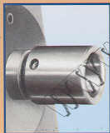
A6 Mandrino di centraggio Mandrin porte-bois Centering spindle Sondenfutter Ø 50/80 mm