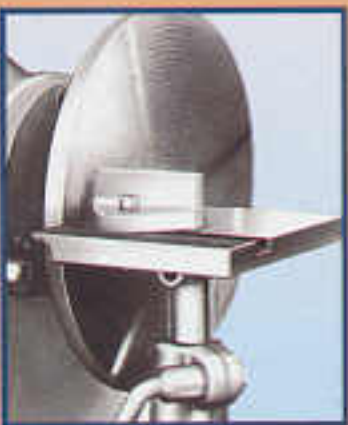
A8 Platorello con disco abrasivo Support avec disque abrasif Sanding disk Schleifeller mit Tisch Ø 300 mm