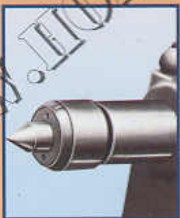
A7 Contropunta girevole CM3 Pointe tournante à billes CM3 Ballbearing center 3 MT Mitlaufende Kornerspitze 3 MK