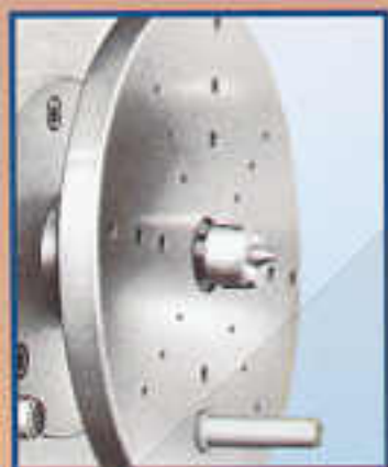
A1 Disco mensa frida Ø 220 mm Plateau pousse-toc Ø 220 mm Face plate Ø 220 mm Mitnehmerscheibe Ø 220 mm